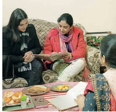
✉ Counseling interview

“Een grote mijlpaal is de lancering van onze eigen YouTube-kanaal. Daarop staan nu de Bijbelstudievaardigheden uitgelegd, maar we gaan hier ook een aantal counseling- en luistervaardighedenprincipes op video zetten met bijbehorende sketches.”